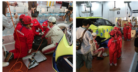
画像参照：「キッズエンジニア」の様子 (兵庫トヨタHPより)

カーエンジニア(自動車整備士)は、自動車の点検や修理をする仕事で、エンジンやブレーキ、タイヤ、ライトなどをくわしく調べて安全で快適に走れるようにします。自動車の調子を良くするためにオイルやバッテリーの交換を行い、故障した場合はどこが悪いのかを調べて部品を交換したり修理したりします。カーエンジニアは自動車や安心して安全に乗れるようにすることで人々の命を守る、社会に無くてはならない仕事です。