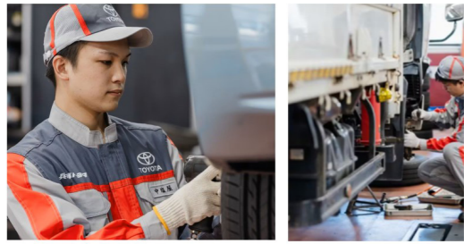
画像参照：「カーエンジニア」が活躍する様子 (兵庫トヨタHPより)

カーエンジニア(自動車整備士)は、自動車の点検や修理をする仕事で、エンジンやブレーキ、タイヤ、ライトなどをくわしく調べて安全で快適に走れるようにします。自動車の調子を良くするためにオイルやバッテリーの交換を行い、故障した場合はどこが悪いのかを調べて部品を交換したり修理したりします。カーエンジニアは自動車や安心して安全に乗れるようにすることで人々の命を守る、社会に無くてはならない仕事です。